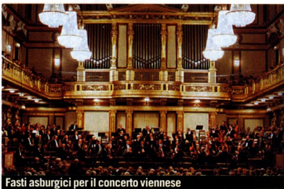
Fasti asburgici per il concerto viennese

Prezzo a partire da €3.773 a persona. Include il pernottamento in b&b per tre notti (dal 30 dicembre 2005 al 2 gennaio '06) presso il cinque stelle Hotel Vienna Marriott,